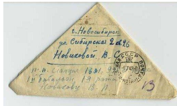
Письмо с фронта

На стенде B1 вы сможете увидеть старинные конверты.