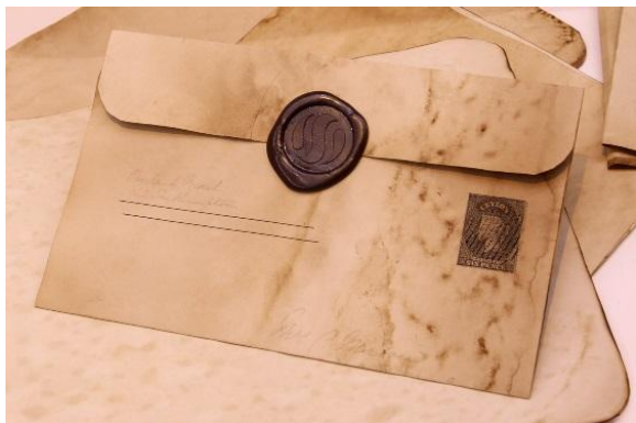
Сургучная печать на конверте

Людам всегда хотелось защитить свои письма от чужих глаз. Поэтому послания сворачивали текстом внутрь и скрепляли печатью из пчелиного воска. Но воск – сторож ненадёжный, его можно размягчить и отклеить.